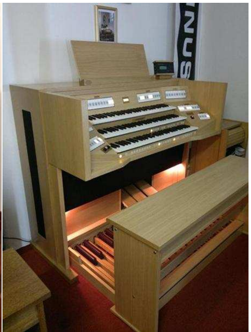
Photo ci-dessus à gauche non contractuelle : modèle avec différentes options d'ébénisterie et plusieurs options techniques