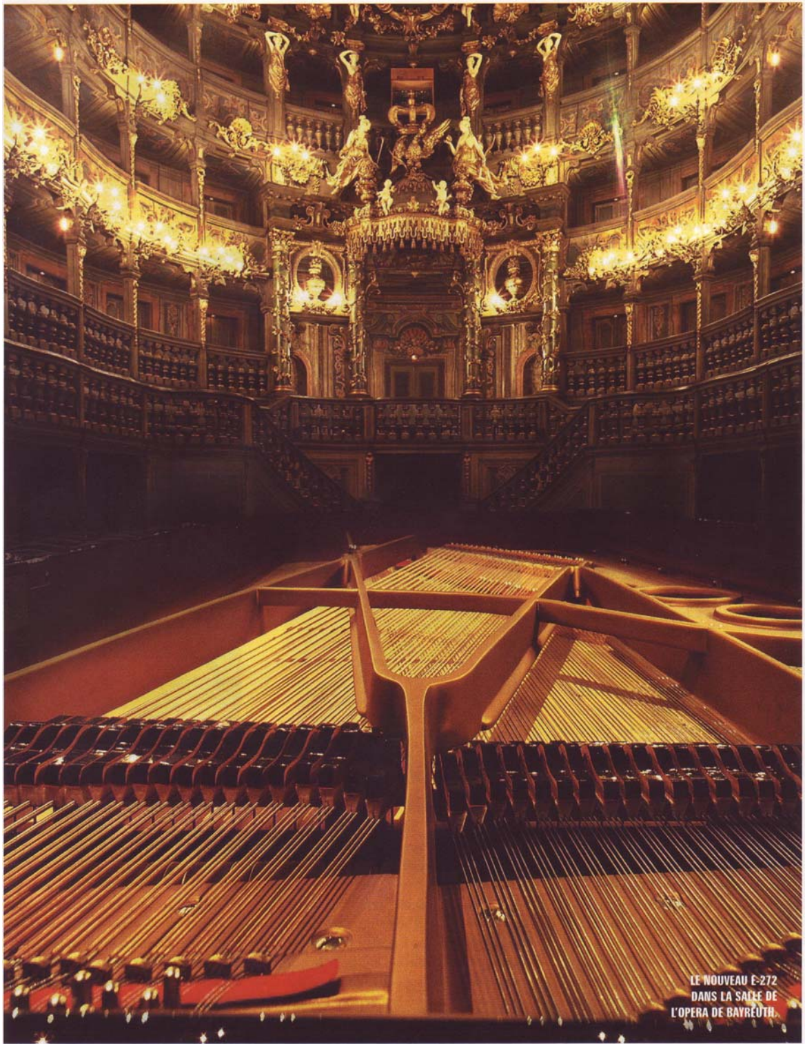
LE NOUVEAU E-272 DANS LA SALLE DE L'OPERA DE BAYREUTH.