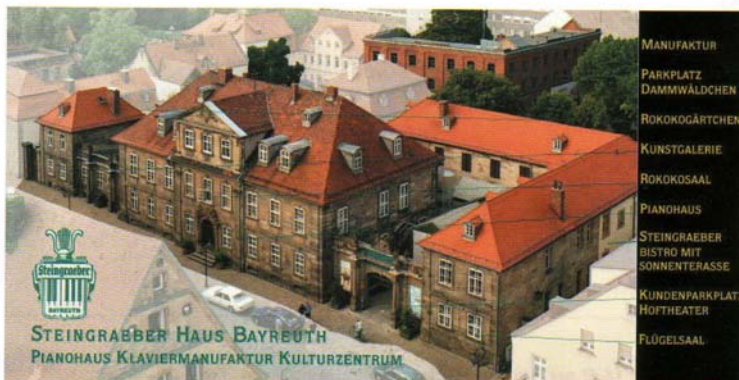
STEINGRAEBER HAUS BAYREUTH PIANOHAUS KLAVIERMANUFATUR KULTURZENTRUM